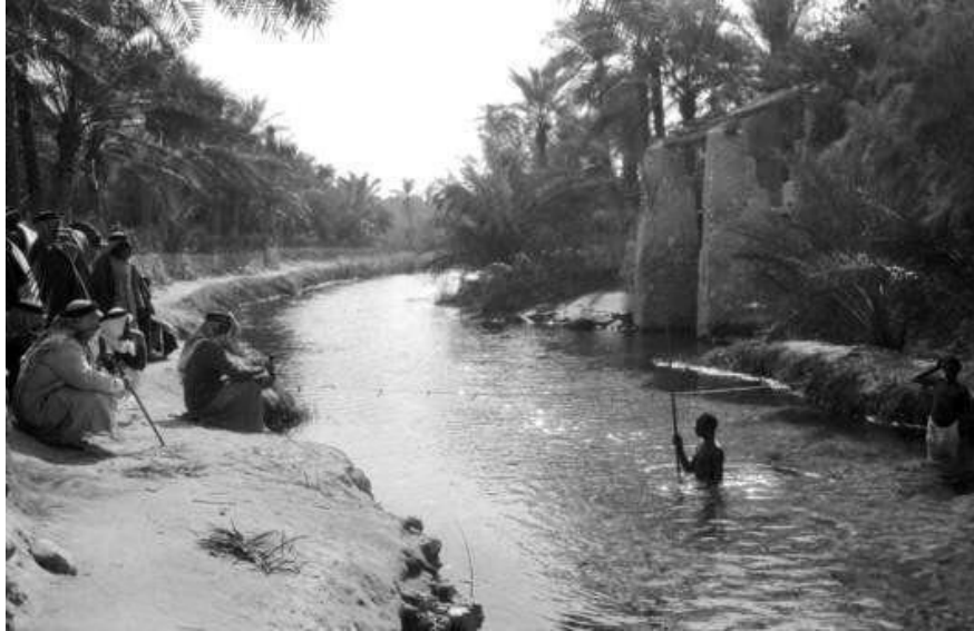
نهر عين الحقل قديمًا.