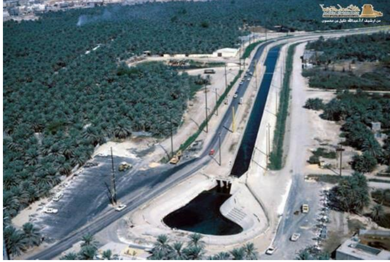
عين الخدود بمدينة الهفوف

وتعد واحدة من أهم وأكبر ينابيع المياه في الأحساء، تقع شرق مدينة الهفوف، يزيد عرض مجراها على عشرين مترًا، وقدر بعض الخبراء كمية المياه المتدفقة منها في الدقيقة الواحدة بـ 20000 جالون، تسقي مياهها جزءًا كبيرًا من البساتين المحيطة بها ويتفرع منها ستة أنهر: